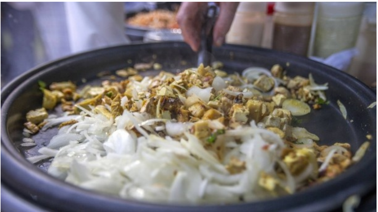
Tacos ganz vegan: Passt zur koscheren Küche

Dessen Grundregel fordert, Fleisch- und Milchprodukte zu trennen. Wer in Israel also auf die Fleischbeilage verzichtet, isst zwangsläufig kein vegetarisches, sondern gleich ein veganes Gericht. Zwischen dem Verzehr eines Steaks und einem Stück Käsekuchen müssen sechs bis acht Stunden liegen.