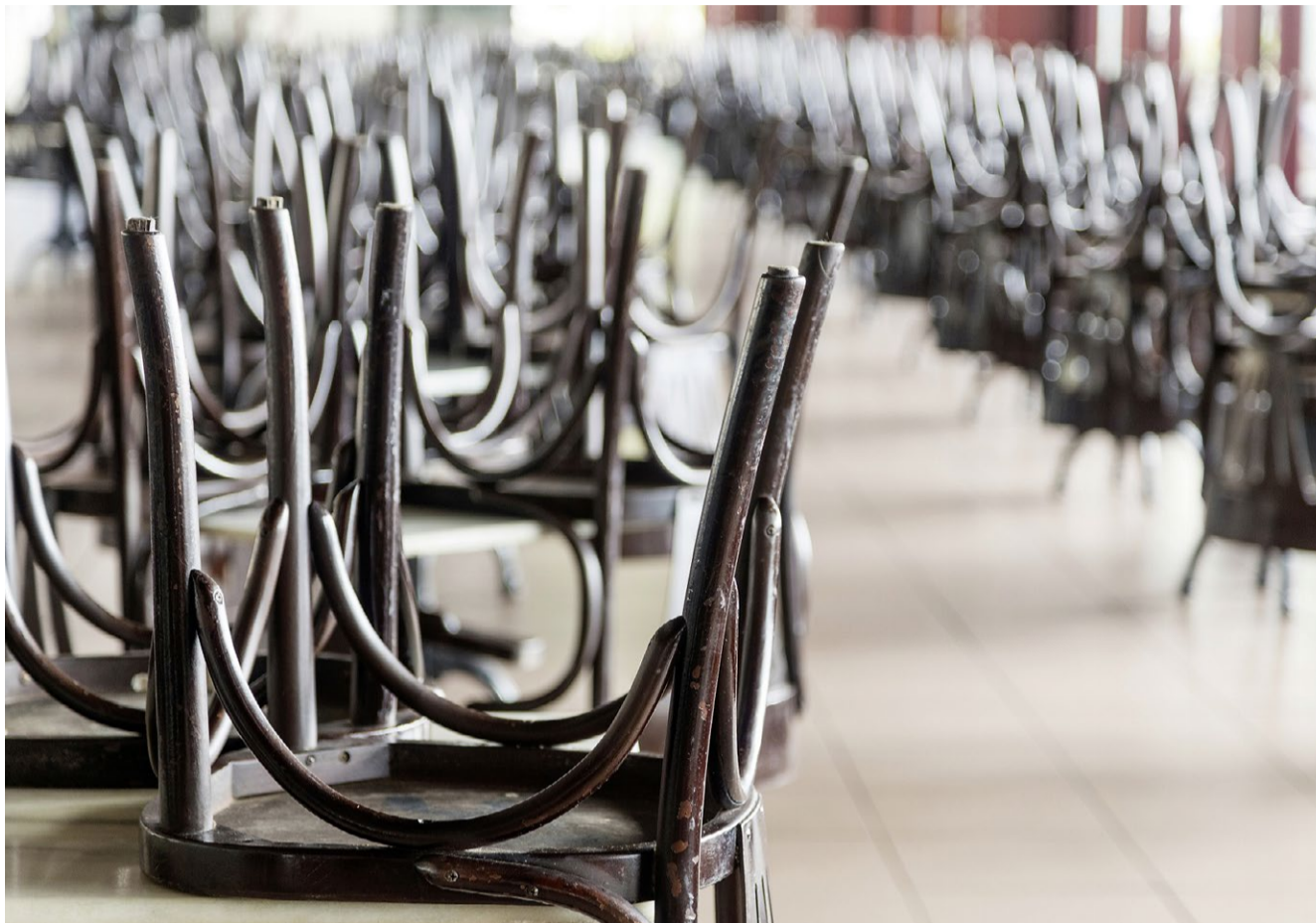
Wenig Erfahrung und viel Konkurrenz: Viele Zürcher Gastrobetriebe können sich nicht lange halten.

Eine Rolle spielt auch der Wandel der Essgewohnheiten in den letzten Jahren. Die Menschen nehmen sich weniger Zeit fürs Essen und ziehen den schnellen Take-away einem Mittagmenü im Restaurant vor. Zudem kochen Zürcherin-