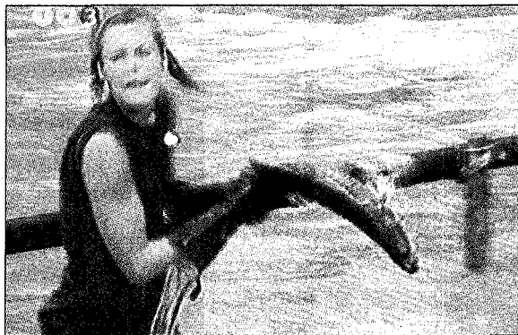
TV3-Robinsone: Spiel mit Fischen.

«Es liegt uns fern, in der «Expedition Robinson» Fische zu quälen. Die Sendung soll attraktiv und spannend sein. Dies wird nicht durch Tierquälerei erzeugt. Der Wettbewerb der Robinsoncamps basierte auf einer uralten Fischfangmethode, die nicht mehr oder weniger human ist als andere Fischfangmethoden. Aus rein visuellen Gründen, um den Fischfang für die Zuschauer besser sichtbar zu machen, wurden dabei Handschuhe eingesetzt. Einige Fische, die für den Verzehr bestimmt waren, wurden unmittelbar nach dem weniger als zehn Minuten dauernden Wettbewerb artgerecht, durch einen Genickschnitt, getötet. Gleichzeitig wurden die übrigen Fische ins Südchinesische Meer freigelassen.»