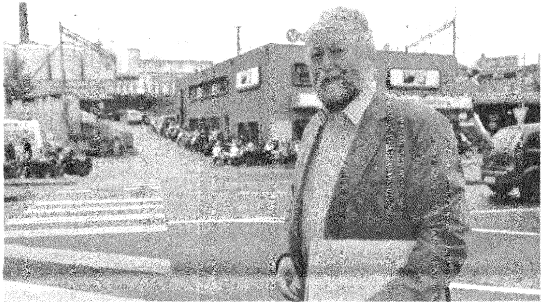
Staatsrat Pascal Corminboeuf auf dem Weg in den Gerichtssaal.

Beschwerde gegen Ayer einreichen, da dieser verjährte Urteile öffentlich verkündete. pj